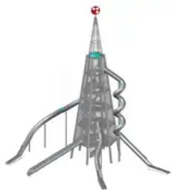
9-11526-001_CLASSIC Thème CLASSIQUE (standard catalogue)